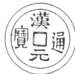
HỒ HÁN THƯƠNG HÁN NGUYÊN thông bảo