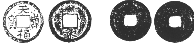
LÊ ĐẠI HÀNH THIÊN PHÚC TRẤN BẢO (chữ Lê năm dưới) THIÊN PHÚC TRẤN BẢO (chữ Lê năm trên)