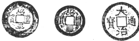
TRẦN DU TÔNG THIỆU PHONG bình bảo THIỆU PHONG nguyên bảo ĐẠI TRỊ thông bảo